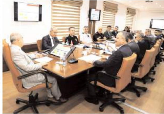
Toplantıda üniversiteler açılmadan önce alınacak tedbirler görüşüldü.

Toplantıda, yurtların genel durumları, kapasite ve disiplin işlemleri, emniyet ve güvenlik gibi konularda ilgili kurumlar tarafından yapılan sunumların ardından öğrencilerin güvenli bir şekilde eğitim almalarını ve huzurlu bir şekilde yurtlarda barınmalarını sağlamak, ihtiyaç ve taleplerini gidermek amacıyla Valilik koordinasyonunda kampüsler, yurtlar , üniversiteler, öğrencilerin genel olarak bulunduğu güzergah ve alanlarda dahil olmak üzere yapılan çalışmalar ve denetimler gözden geçirildi.